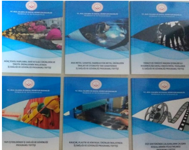
Resim 6: 2018 Yılında Kitaplaştırılan 2017 Yılı Programlı Teftiş Sonuç Raporları

Ayrıca, programlı teftiş sonuçlarının sosyal taraflarla paylaşılması amacıyla, 2017 yılında yürütülen 8 programlı teftişe ilişkin sonuç raporları 2018 yılında kitaplaştırılarak sosyal taraflara dağıtılmış (Resim 6), yine Uluslararası Çalışma Örgütüne (ILO) gönderilmek üzere 2017 yılı iş teftiş faaliyetlerine ilişkin İş Teftişi Genel Raporu da Türkçe ve İngilizce olarak kitaplaştırılmıştır (Resim 7).