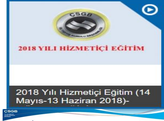
Resim 2: Uzaktan Eğitim Sisteminden Yürütülen Eğitime İlişkin Fotoğraflar