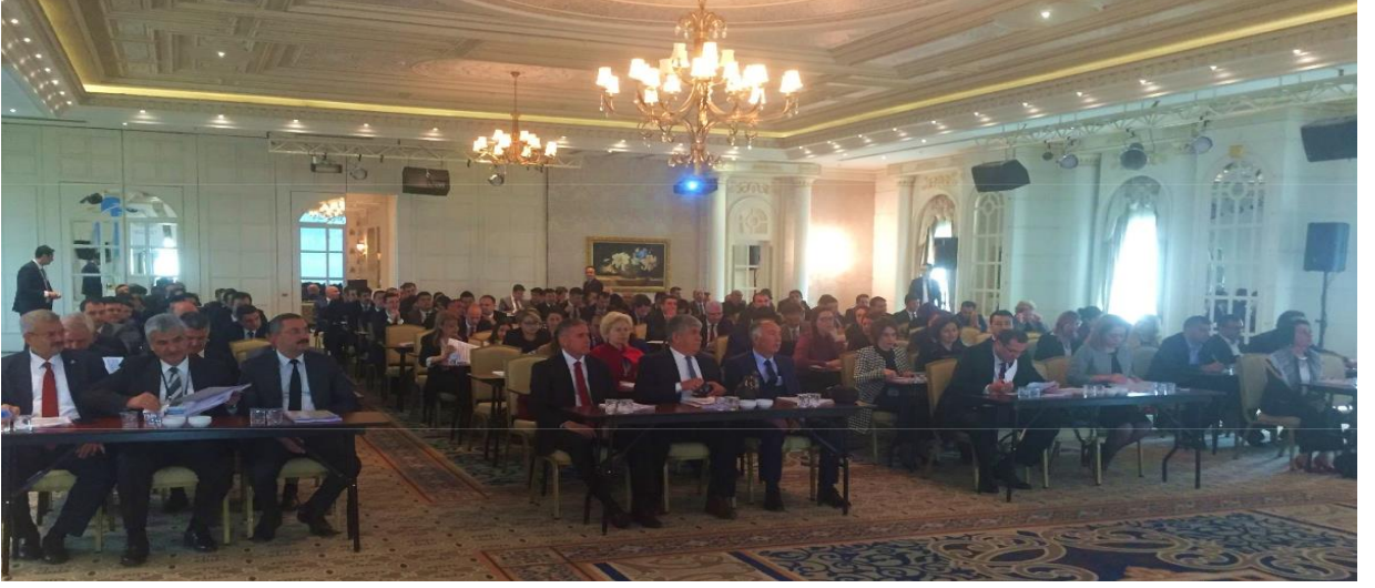
Resim 1: UNICEF İşbirliği ile Düzenlenen Çocuk Hakları ve İş İlkeleri Eğitimi'nden Fotoğraflar